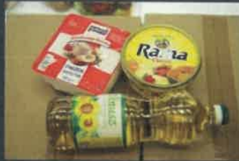
Zsírok, olajok, mert dugulást okozhatnak