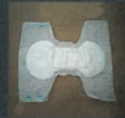
Papírpelenka, betét mert dugulást okozhatnak