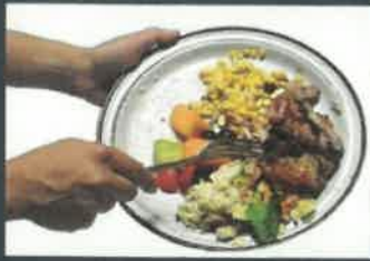
Ételmaradékok, mert dugulást okozhatnak